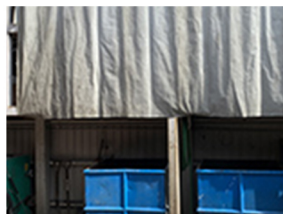
産業廃棄物分類棚