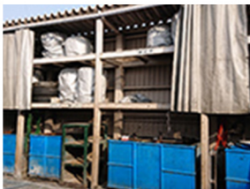
産業廃棄物分類棚