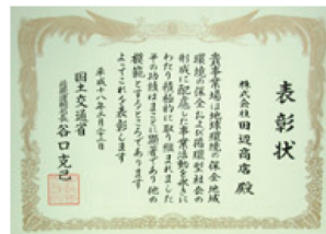
近畿運輸局長表彰状