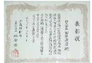
大阪運輸支局長表彰状

「環境保全優良自動車関連事業場等表彰制度」が平成15年度に創設され、当社がその第1回目の大阪運輸支局長表彰の栄に浴され、平成16年度においても連続表彰されました。さらに、3年連続表彰となる平成17年度には、これまでの実績を改めて評価いただき、近畿運輸局長表彰の栄を賜ることとなりました。